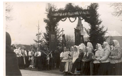
Spomienka na posviacku v roku 1948 so sluhom Božím biskupom Jánom Vojtaššákom