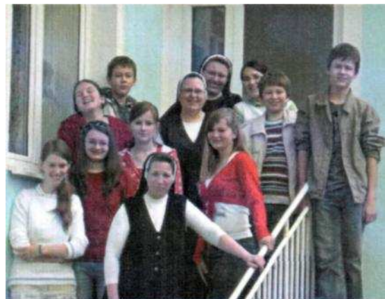
Spoločná fotografia na záver duchovnej obnovy mládeže Klčova