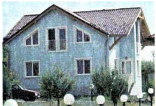
Základná umelecká škola