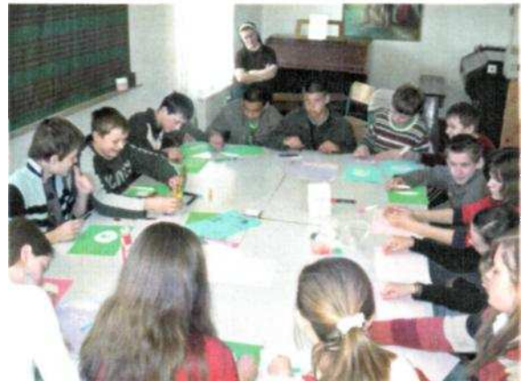
Mládež pri spoznávaní cesty a priblíženia sa k Bohu